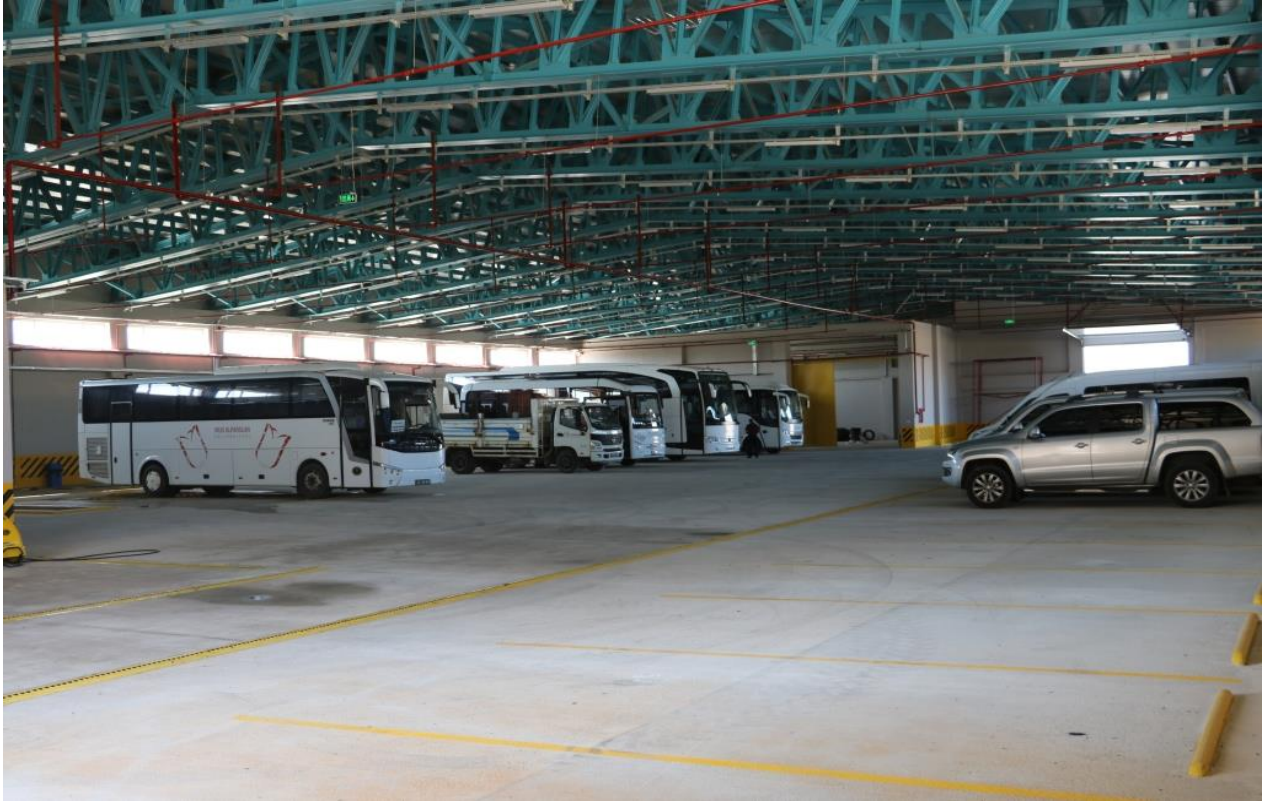
Resim 9 Hangar

2017 yılında ihale süreci tamamlanarak yapımına başlanılan “Hangar” yapım işi 2018 yılsonu itibari ile tamamlanmıştır.