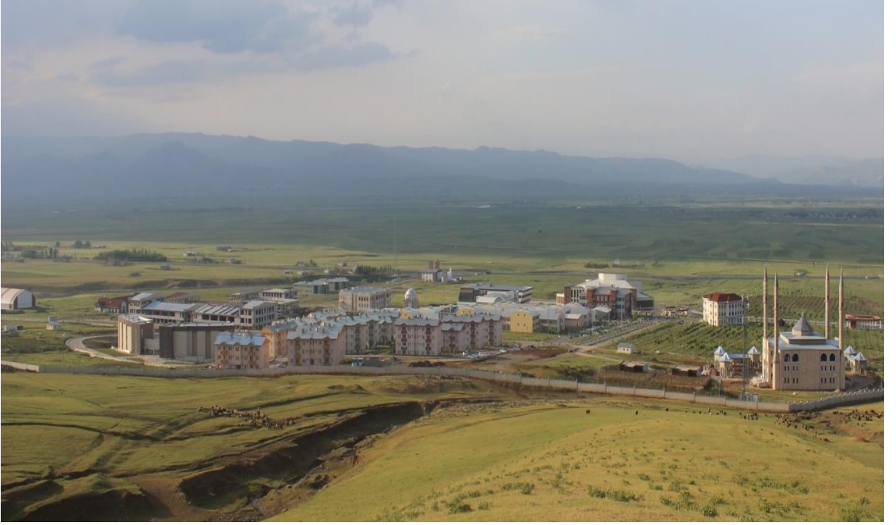
Resim 1 Külliye Alanı

“Kasor Kapı Nizamiyesi” yapım işi 2018 yılsonu itibariyle %100 tamamlanmıştır.