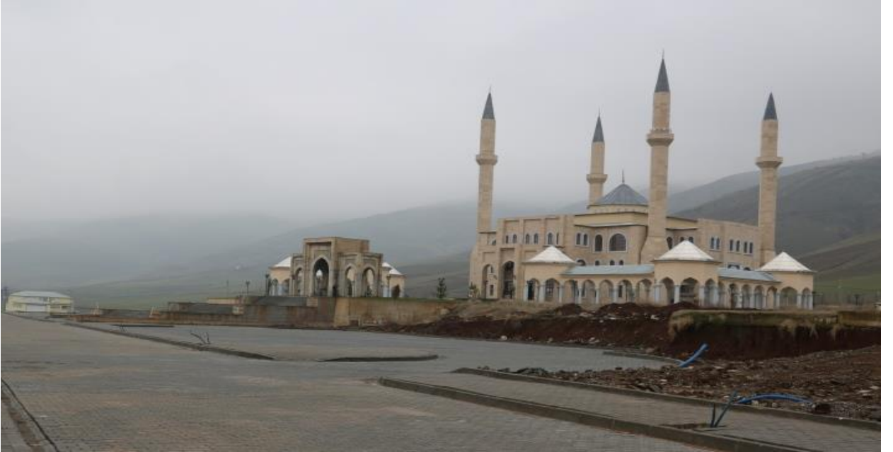
Resim 5 Sultan Muhammed Alparslan Cami

Türkiye Diyanet Vakfı tarafından yapımı üstlenilen Sultan Muhammed Alparslan Cami'sinin Peyzaj ve yol çalışmaları devam etmektedir.