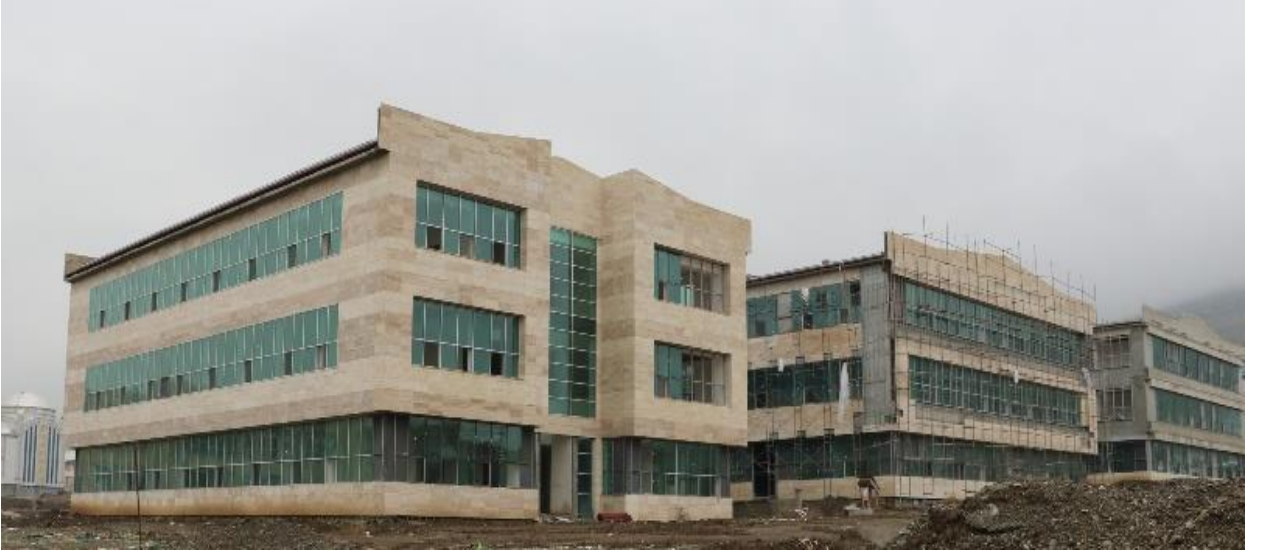
Resim 2 Fen Edebiyat Fakóltesi 1'inci Etap

“Derslik ve Merkezi Birimler” projesine baęlı olarak; 2017 yılında ihalesi yapılan 14.000 m 2 kapalı alana sahip “İslami İlimler Fakóltesi” yapım işinin, 2018 yılsonu itibariyle %30,98'i tamamlanmış olup, inşaat çalışmaları devam etmektedir.