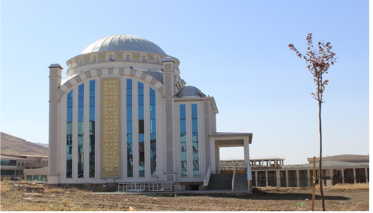
Resim 6 Gazze Cami

Muş Alparslan Üniversitesi Kalkındırma Vakfı tarafından yapımı üstlenilen Gazze Cami'sinin inşaat çalışmaları devam etmektedir.