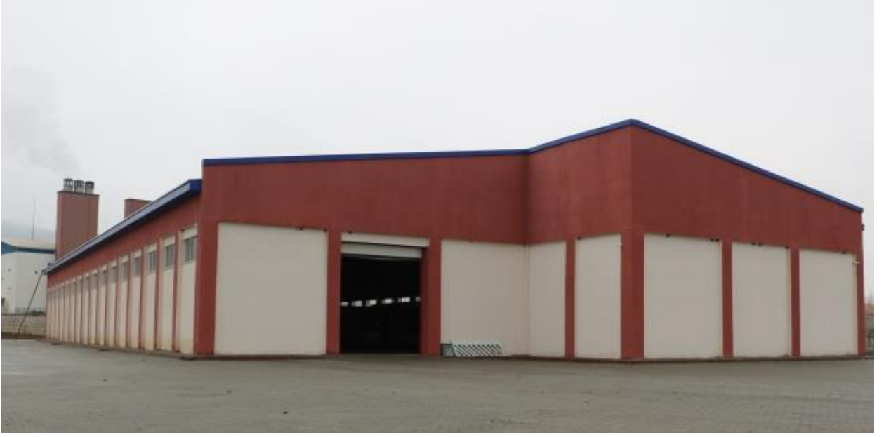
Resim 4 Hangar

“Derslik ve Merkezi Birimler” projesine baęlı olarak; 2017 yılında ihalesi yapılan 2.250 m 2 kapalı alana sahip “Hangar” yapım işinin, 2018 yılsonu itibariyle %100'ü tamamlanmış olup, geçici kabulü yapılmıştır.