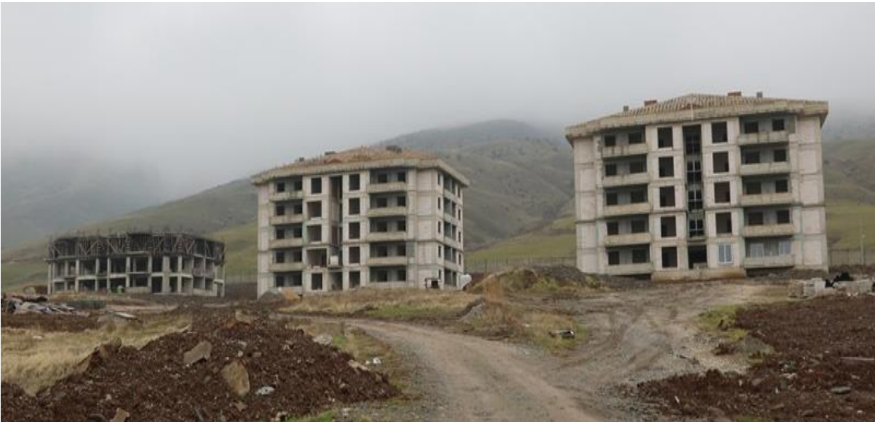
Resim 7 Lojmanlar ve Sosyal Tesisler

“Lojmanlar ve Sosyal Tesisler” projesine bağlı olarak; “2017 yılında ihalesi yapılan 6.240 m 2 kapalı alana sahip “Lojman (80 Daire)” yapım işinin, 2018 yılsonu itibariyle %41,77’si tamamlanmış olup, inşaat çalışmaları devam etmektedir.