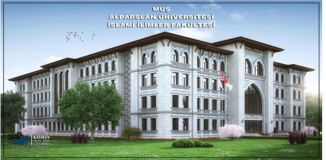
Resim 3 İslami İlimler Fakóltesi

“Derslik ve Merkezi Birimler” projesine baęlı olarak; 2017 yılında ihalesi yapılan 14.000 m 2 kapalı alana sahip “İslami İlimler Fakóltesi” yapım işinin, 2018 yılsonu itibariyle %30,98'i tamamlanmış olup, inşaat çalışmaları devam etmektedir.