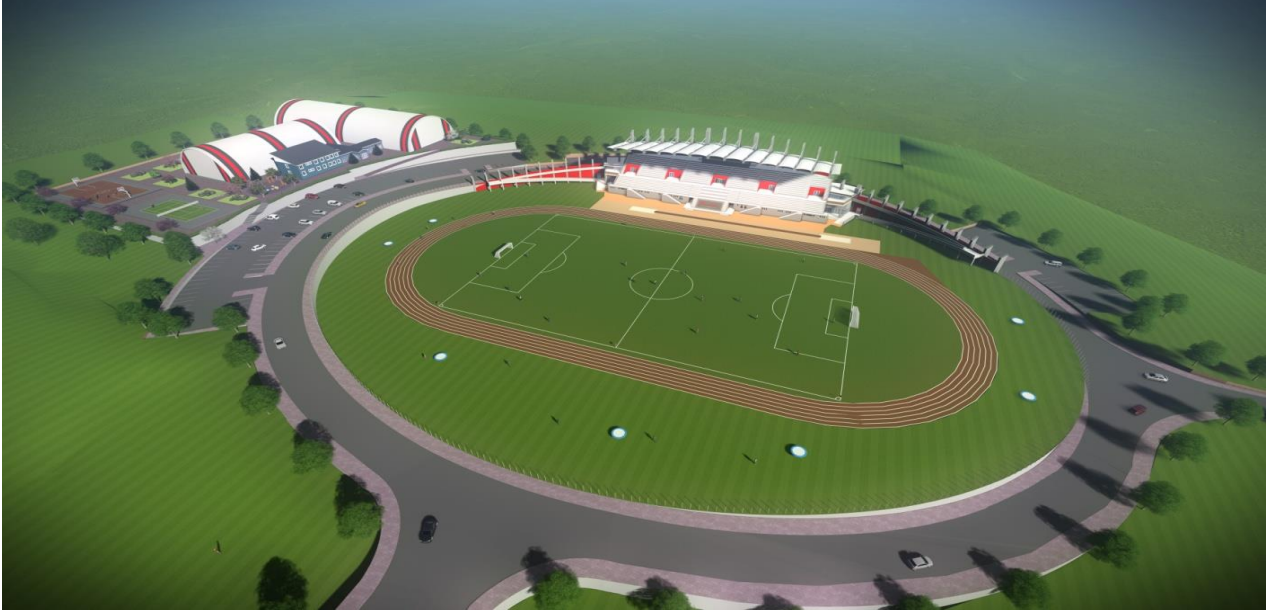
Resim 8 Açık Spor Tesisleri

“Açık ve Kapalı Spor Tesisleri“ projesine bağlı olarak, 2017 yılında ihalesi yapılan 40.777 m 2 alana sahip “Açık Spor Tesisleri” yapım işinin, 2018 yılsonu itibariyle %30,17’si tamamlanmış olup, inşaat çalışmaları devam etmektedir.